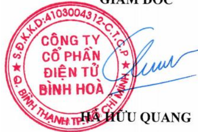
HÀ HỮU QUANG